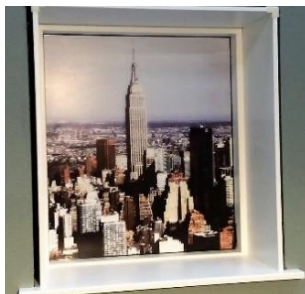
Herefter kan afdækningsliste/gerigt monteres på sider.