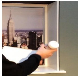
Lim påføres kant/smig.