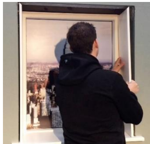
Placer sidepladerne i not.