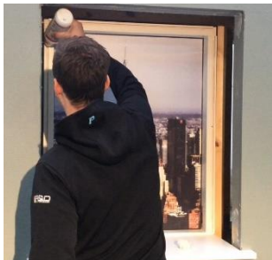
Læg lim i not.

Brug lim eller fugemasse til at montere afdækningsliste i not og mod væg. Når limen er tør, fjernes Basic 45 hjørnesamlinger og der fuges i alle åbne samlinger. Ved 4-sidet lysning følges procedure som nedenfor, dog placeres bundplade og denne nivelleres og klodses op så den ligger stabilt, som det første efter påføring af lim i noter.