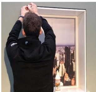
Top- og sideplade samles med Basic 45 hjørnesamlinger